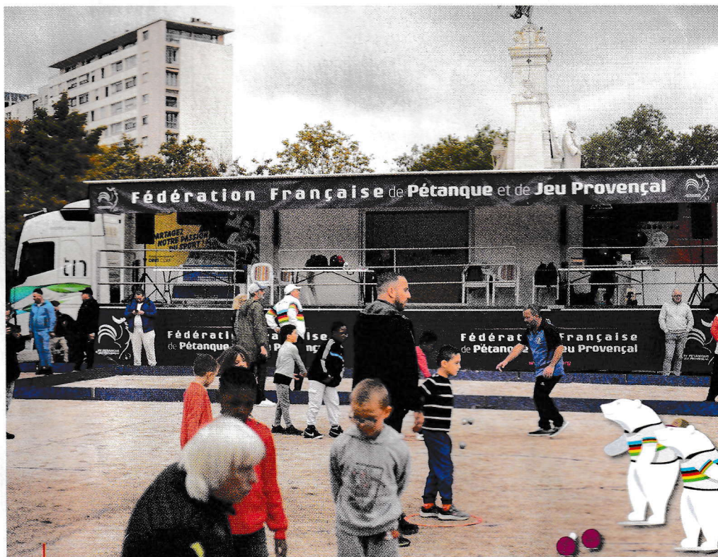
La pétanque traverse les générations, comme cela a de nouveau été le cas lors du Pétanque Tour place de la République au mois d'octobre.

Qui n'a jamais tiré ou pointé, un dimanche après-midi en famille ou entre amis ? À Dijon, 234 habitants sont licenciés dans l'un des six clubs de pétanque, et ils sont des centaines à pratiquer juste pour le plaisir. La pétanque, c'est le sport accessible par excellence ! Tout le monde, quel que soit son âge ou son niveau, peut y jouer. Il suffit d'avoir un jeu de boules en acier (ou en plastique pour les enfants), un cochonnet et un terrain gravillonné mais pas trop caillouteux. « Convaincue des bienfaits de ce sport qui favorise le vivre-ensemble, la ville aménage de nombreux terrains dans les parcs de tous les quartiers », explique Claire Tomaselli adjointe au maire de Dijon déléguée aux sports et à l'olympisme. Les Dijonnais peuvent profiter de 10 bouledromes entretenus et de très nombreux terrains de proximité, comme au stade Maladière par exemple. Ces aménagements émanent souvent d'un vœu des habitants, formulé dans les Ateliers de quartier. Grâce au budget alloué par la ville à ces neuf instances de participation citoyenne, des nouveaux bouledromes ont vu le jour cet été place Granville et dans le parc des Grésilles ; un nouveau terrain de proximité est également inauguré ce mois-ci au Tempo dans le quartier Chevreul-Parc.